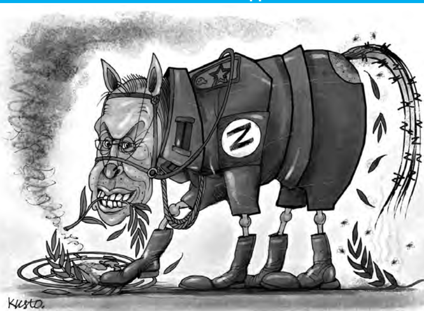
Постійне членство окупанта у Раді Безпеки ООН має бути призупинено. Мал. Олексія КУСТОВСЬКОГО.