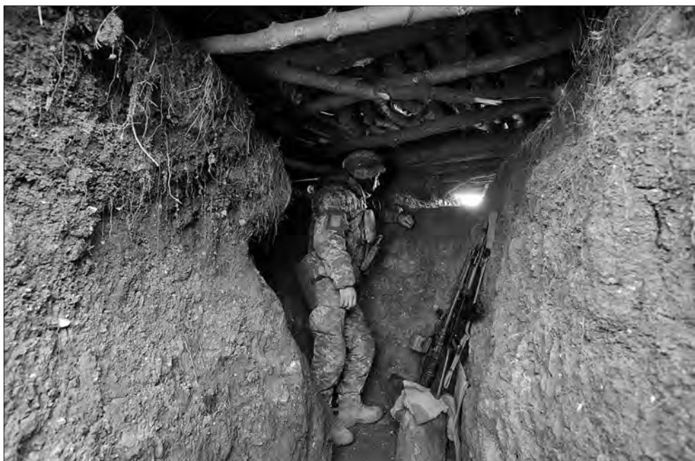
«Лоцман» із Дніпра: 50 років, на війні з серпня 2022-го.