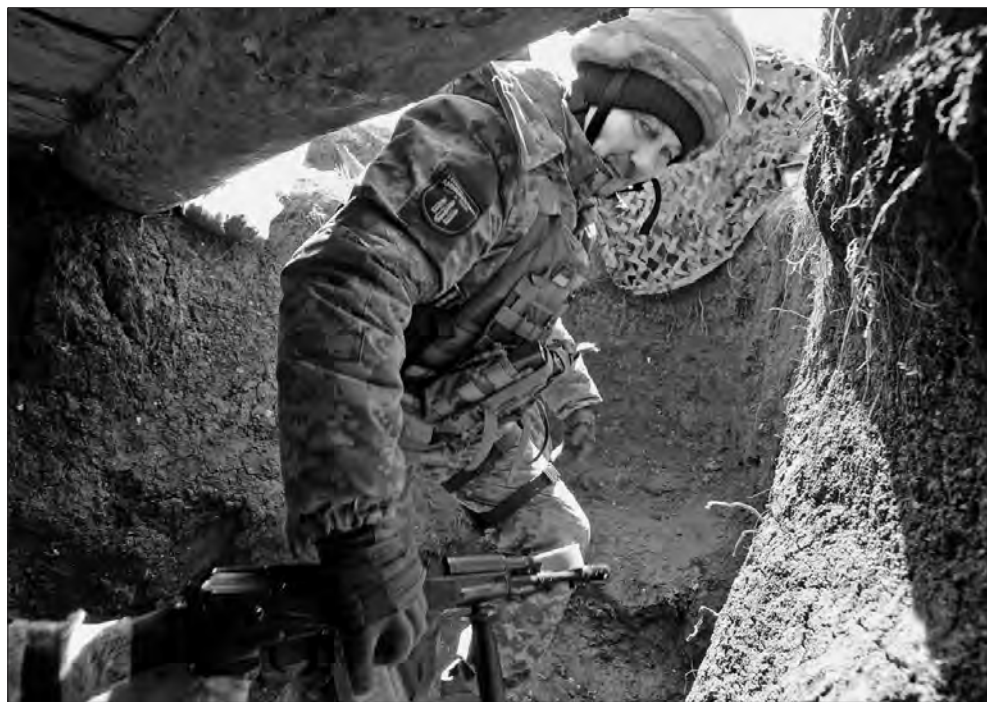
«Шаман» із Корсунь-Шевченківського: 25 лютого 2022 року пішов добровольцем до Харківської тероборони — відтоді й воює.

— Прогнози — річ невдячна. Але все-таки дозволю собі сказати, що війна триватиме як мінімум до кінця року. В будь-якому випадку, думаю,