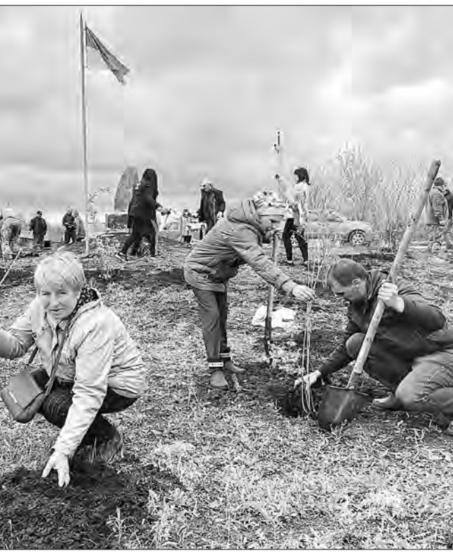
Під час висадки дерев на Донеччині.

«Цьогоріч в області плануємо висадити два мільйони сіянців деревних порід, зокрема навесні — 1,4 мільйона, — повідомив Віталій Ільчин. — Від початку року